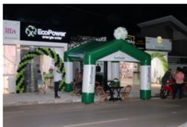
Primavera do Leste/MT