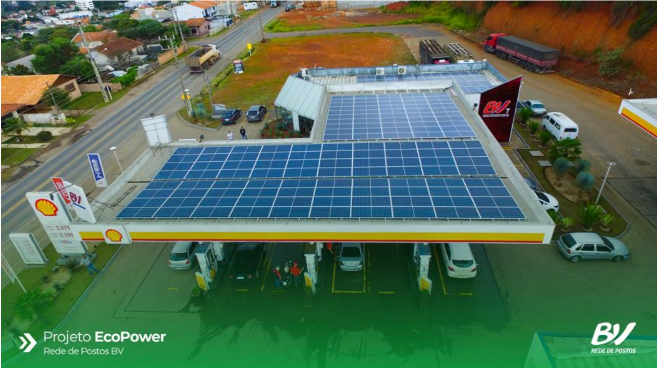
» Projeto EcoPower Rede de Postos BV