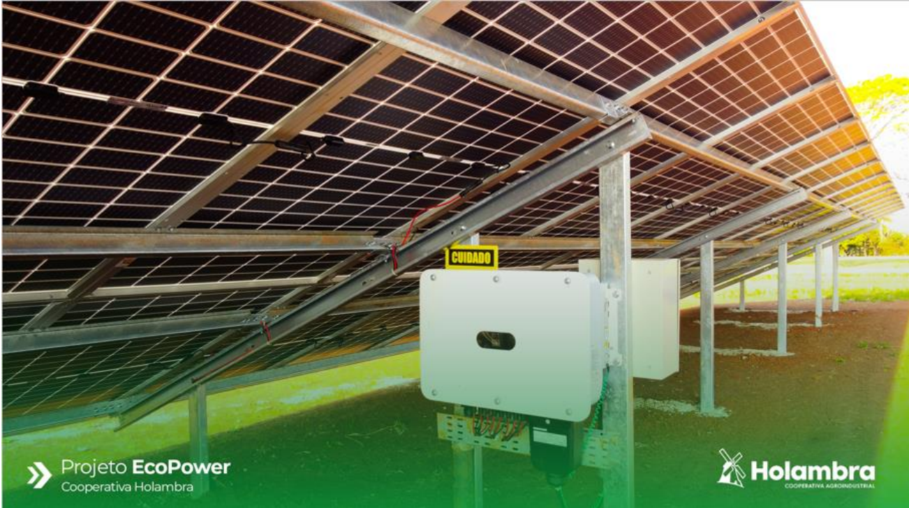
» Projeto EcoPower Cooperativa Holambra