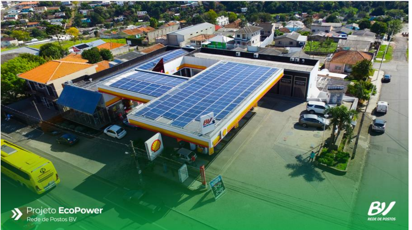
» Projeto EcoPower Rede de Postos BV