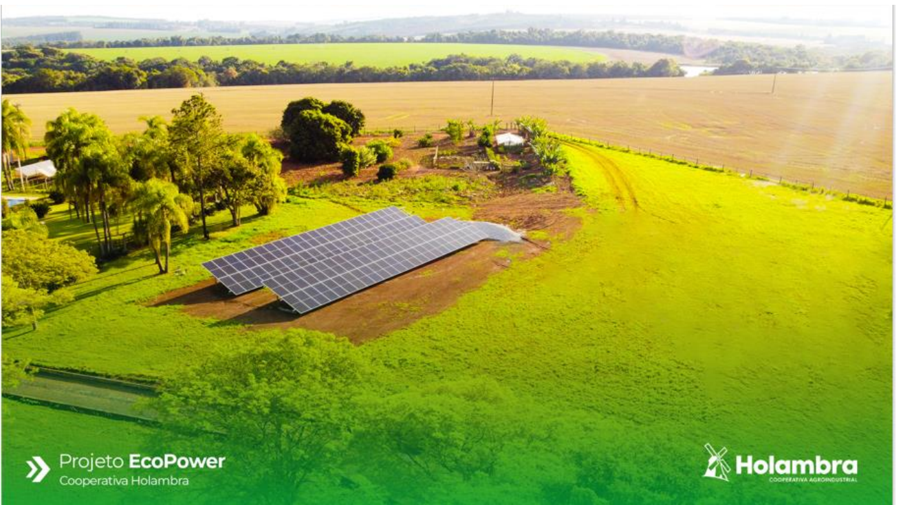
» Projeto EcoPower Cooperativa Holambra