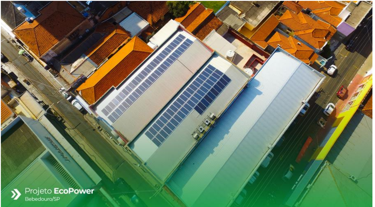
» Projeto EcoPower Bebedouro/SP