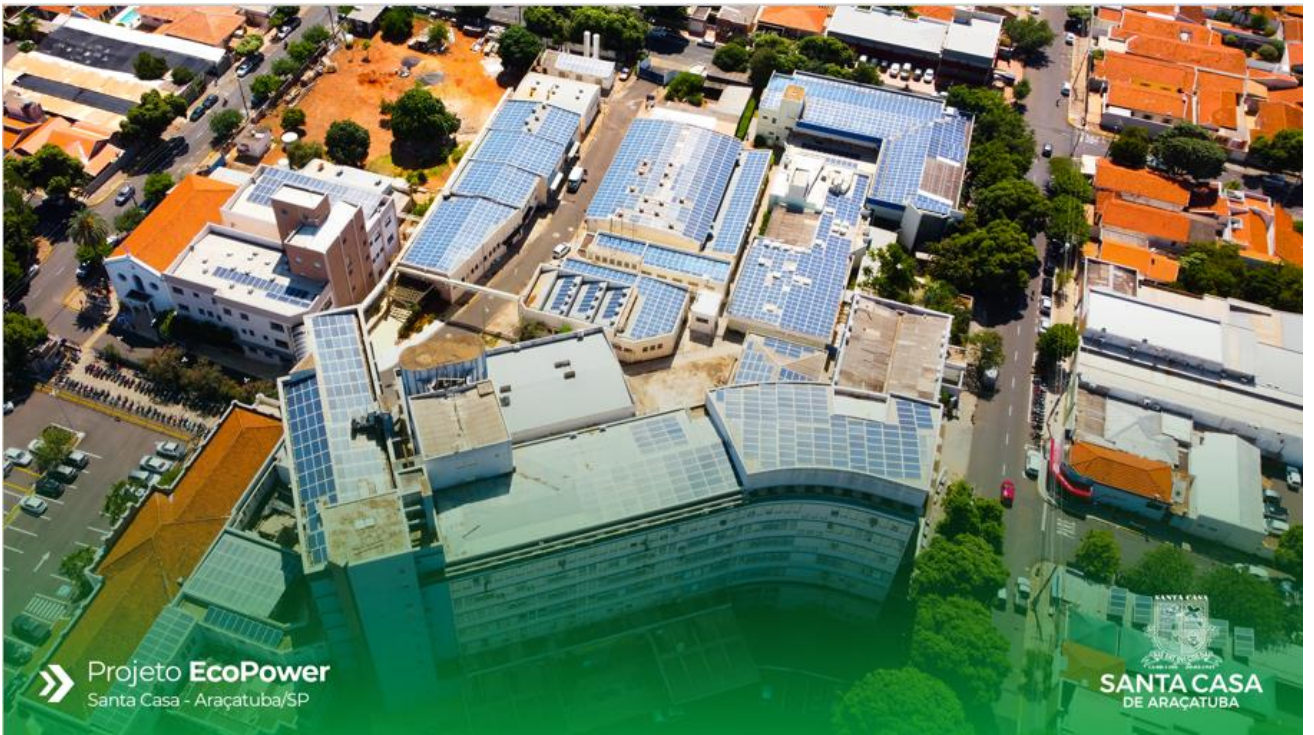
» Projeto EcoPower Santa Casa - Araçatuba/SP