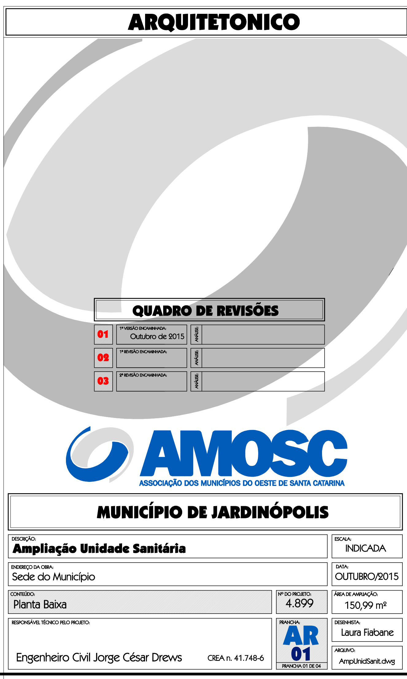
PLANTA BAIXA ESCALA 1:75