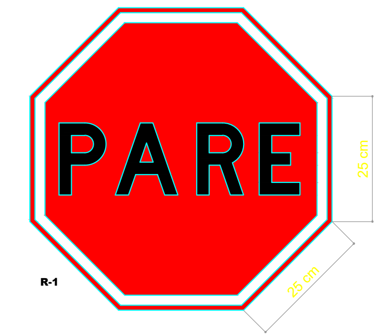
DETALHE 01 PARADA OBRIGATÓRIA ESCALA ..... 1/ESCALA